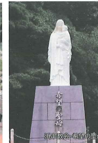
希望の聖母 浜串教会・希望の聖母